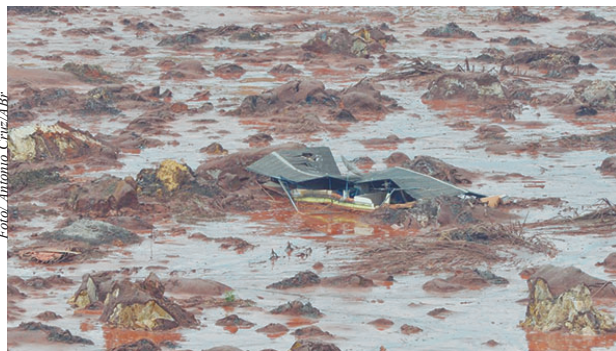
informou a mineradora.

As indenizações têm sido pagas no prazo médio de 20 dias nos casos em que a documentação é apresentada de forma completa no momento do ingresso,