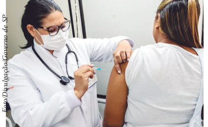
Mortes por influenza se concentram em idosos

O estudo está sendo conduzido por centros de pesquisas de oito estados brasileiros de oito municípios: Campinas, Valinhos, Ribeirão Preto, Sorocaba, São José do Rio Preto, São Caetano do Sul e a capital, São Paulo (SP); Vitória (ES); Porto Alegre (RS); Belo Horizonte (MG); Salvador (BA); Recife (PE); Laranjeiras (SE) e Natal (RN), e envolve 7.200 voluntários. Metade dos participantes receberá a vacina adjuvada do Butantan e outra metade uma vacina da gripe de alta dose, atualmente disponível na rede privada e indicada para o público 60+, permitindo a comparação entre os imunizantes. Os participantes serão acompanhados durante seis meses.