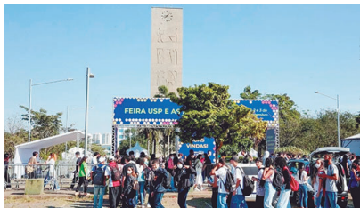
O evento retorna à Cidade Universitária em 2026, após dois anos em formato digital

Estrutura e ações interativas Este ano a Feira USP e as Profissões conta com três grandes pavilhões para o atendimento aos visitantes na Praça do Relógio, marco arquitetônico e símbolo da Universidade. São reunidos estandes com alunos e docentes da USP que apresentam as carreiras e esclarecem dúvidas sobre os cursos oferecidos, as profissões, o mercado de trabalho, a formação acadêmica, disciplinas e conteúdos programáticos, além do cotidiano universitário e as possibilidades de especializações. Também serão realizadas apresentações e atividades em um palco central.