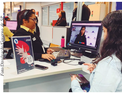
A renovação da parceria reforça o compromisso do Governo de São Paulo em ampliar a acessibilidade nos serviços públicos e garantir que todas as pessoas possam exercer plenamente seus direitos, fortalecendo uma sociedade cada vez mais inclusiva.

Atualmente, a Central de Interpretação de Libras está presente em diversos equipamentos