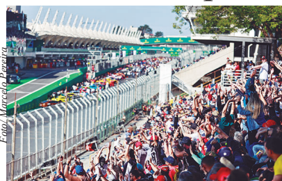
Linhas deixarão a estação Autódromo em direção aos portões de entrada

A tarifa será a mesma do sistema municipal de transporte: R$ 5,30 na sexta-feira e no sábado, com aceitação de todas as modalidades do Bilhete Único. No domingo (12), quando a cidade de São Paulo promove o programa Domingão Tarifa Zero , as viagens nos ônibus municipais, incluindo a linha especial, serão gratuitas.