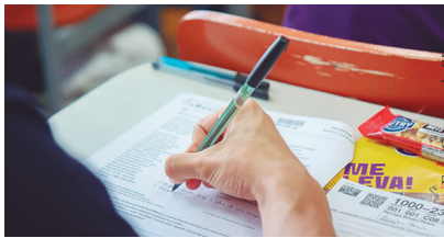
A USP oferece três formas de ingresso para os novos estudantes: o vestibular da Fuvest, o Enem-USP e o Provão Paulista.

A USP oferece três formas de ingresso para os novos estudan-