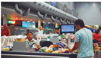
2026, o mercado projeta 5,11%.

O IPCA de maio veio acima da estimativa do mercado. O Boletim Focus da última segunda-feira (8), sondagem do Banco Central (BC) com agentes do mercado financeiro, projeta que a inflação de maio ficaria em 0,48%. Para o fim de