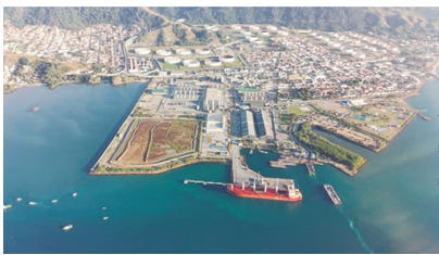
A maior parcela, de R$ 1,69 milhão, será direcionada às ações de emergência e treinamentos operacionais.

Segundo Ernesto Sampaio, presidente do Porto de São Sebastião, o investimento busca