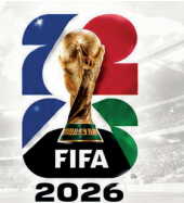
TABELA JOGOS COPA DO MUNDO 2026