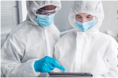
biossegurança previstos para esse tipo de situação. Ela apresentou resultado negativo no teste rápido para malária. Até o momento, não há confirmação laboratorial da doença pelo vírus Ebola. As análises são conduzidas pelo Instituto Adolfo Lutz (IAL).

A paciente está estável e permanece em leito de isolamento no IIER, seguindo os protocolos de