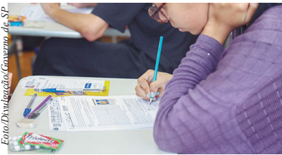
Com o simulado, estudantes podem vivenciar as condições reais do vestibular da USP

A Fuvest tem inscrições abertas até o dia 10 de julho para estudantes interessados em obter a inscrição ou redução da taxa de inscrição, que nesta edição do vestibular é de R$ 228,00. Os pe-