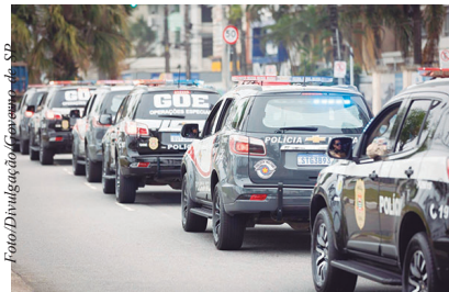
São Paulo registra há três anos consecutivos a menor quantidade de homicídios dolosos da série histórica

As informações auxiliam as autoridades no planejamento de políticas públicas e na elaboração de estratégias voltadas à prevenção de latrocínios e homicídios.