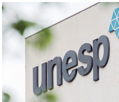
O exame terá duração de cinco horas, com permissão para alimentação e hidratação durante sua realização

A Unesp realizará neste domingo (24) a prova da primeira fase do Vestibular Meio de Ano 2026, com 4.434 candidatos para 180 vagas, sendo 36 para língua e cultura chinesas, disponível em Assis e oferecido pela primeira vez no país, e 144 para as engenharias agrônoma, civil, elétrica e mecânica, em Ilha Solteira. Os candidatos podem consultar o local de prova no site da Fundação Unesp, responsável pela seleção.