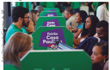
dez dias úteis após a regularização no sistema.

Encerradas as atividades do Feirão, as empresas participantes terão até cinco dias úteis para encaminhar à SDUH um relatório detalhado com as famílias atendidas e as unidades comercializadas. A partir dessas informações, será possível autorizar a utilização dos recursos e liberar os subsídios. Para empreendimentos ainda não cadastrados, a emissão poderá ocorrer em até