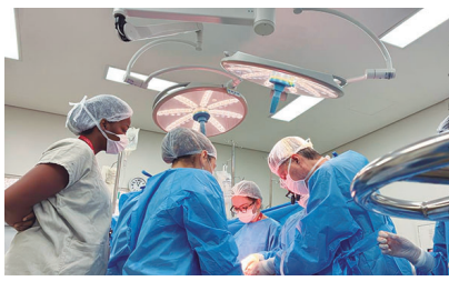
Recusa familiar recusa familiar teve queda de 1,3 ponto percentual

Hoje, 28.852 pacientes aguardam por um transplante em São Paulo. Para facilitar o acesso às informações, a SES-SP disponi-