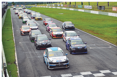
▲ última vez que a Turismo Nacional esteve em Goiânia, em 2024

Goiânia recebe Turismo Nacional com campeonato embolado após Cascavel