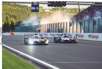
Dobradinha histórica da BMW em Spa!

Também houve motivos para comemoração na Genesis Magma Racing. Em apenas sua segunda