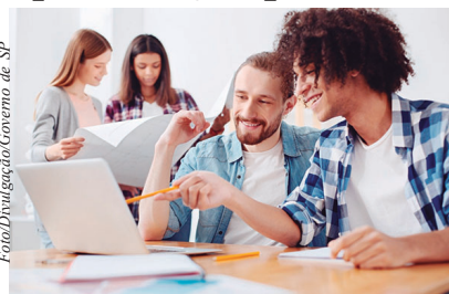
Com o auxílio de Inteligência Artificial, a plataforma oferece ferramentas como simulação de entrevistas alinhadas a processos seletivos para capacitar os candidatos

Nos cursos do Trampoline, mesmo conteúdos técnicos, como informática, são aplicados de forma a estimular competências comportamentais. As inscrições devem ser realizadas pelo site www.trampoline.sp.gov.br , com login via conta gov.br. Na