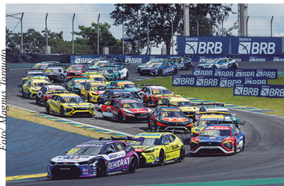
Largada da corrida principal da BRB Stock Pro Series em Interlagos

da mais cerebral, pensando em somar pontos para o campeonato. O resultado foi importante dentro desse contexto”, explicou.