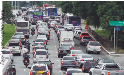
produtos que mais contribuíram para essa alta foram: