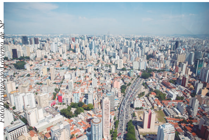
Os valores correspondem a 25% da arrecadação do imposto, que são distribuídos às administrações municipais

Os valores semanais transferidos aos municípios paulistas variam em função dos prazos de pagamento do imposto fixados no regulamento do ICMS. Depen-