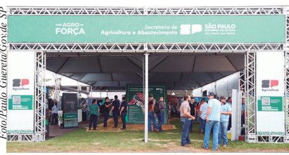
Entre os destaques, está o espaço destinado ao crédito rural, por meio do Fundo de Expansão do Agronegócio Paulista (FEAP)

o espaço destinado ao crédito rural, por meio do Fundo de Expansão do Agronegócio Paulista (FEAP), que amplia o acesso a financiamentos com condições facilitadas para pequenos e médios produtores. Desde 2023, o programa já disponibilizou mais de R$ 800 milhões em crédito, com taxas subsidiadas e linhas voltadas à modernização da produção, irrigação, sustentabilidade, apoio à pecuária e mulheres do agro. Com atendimento no local, o espaço busca estimular investimentos produtivos e aumentar a competitividade do setor no estado.