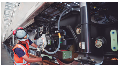
As inscrições são gratuitas e devem ser feitas exclusivamente pela internet, a partir das 14h do dia 27 de abril até as 21h do dia 8 de maio de 2026