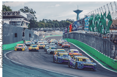
Autódromo de Interlagos recebe as provas 160 e 161 da história da Stock Pro Series