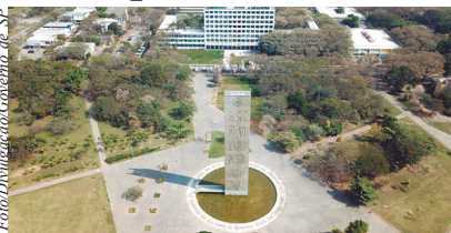
Processo de pré-seleção é no 2º semestre de 2026 e no 1º semestre de 2027

para os candidatos aos cursos da área de Humanidades, serão apresentados 34 testes de Língua Portuguesa, 12 testes de Língua Inglesa e 34 testes de conhecimentos sobre Cultura