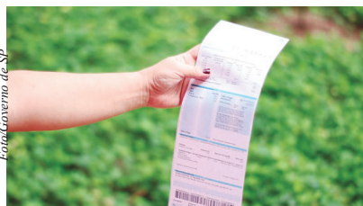
Com a nova regra, passam a existir limites claros para a cobrança de encargos e fortalece o direito à informação

Outra mudança importante é a ampliação das formas de pagamento, que passam a incluir, além da fatura regular, opções como Pix e cartão de crédito. Também será possível incluir parcelas di-