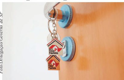
O valor das cartas de crédito é de R$ 16 na capital paulista, de R$ 10 mil para São João da Bela Vista e R$ 13 mil para as demais cidades do interior do estado

O evento segue as regras estabelecidas na resolução publicada em 1º de setembro. Os feirões são organizados por entida-