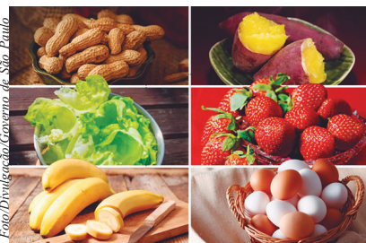
Agronegócio paulista se consolida como protagonista ao liderar a produção de diversos alimentos essenciais à prática esportiva

"O amendoim tem aumentado a participação no contexto fi-