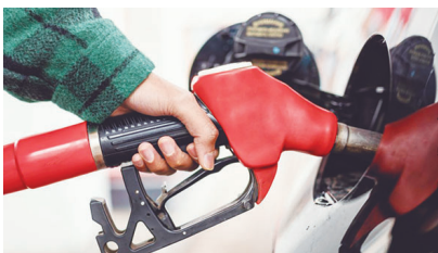
A fiscalização constante do Ipem-SP tem um papel fundamental na proteção dos consumidores e dos comerciantes que trabalham dentro da legalidade, que podem ser prejudicados por fraudes na medição do combustível

O Ipem-SP (Instituto de Pesos e Medidas do Estado de São Paulo), autarquia do Governo do Estado, vinculada à Secretaria da Justiça e Cidadania, oferece um serviço fundamental para a segurança do consumidor: a localização de bombas de combustíveis que passaram por um processo rigoroso de fiscalização e certificação antifraude. A plataforma digital do instituto, que já contabiliza mais de 120 mil acessos, reflete a crescente preocupação da população com possíveis fraudes em postos de combustíveis e consolida o Ipem-SP como um aliado essencial na garantia da transparência e da correta medição do combustível, protegendo tanto o bolso do consumidor quanto a integridade das empresas que cumprem as normas.