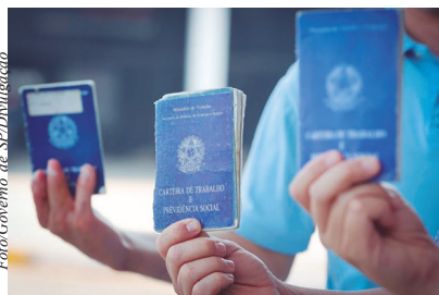
Veja os programas do Governo de São Paulo para quem busca emprego.

Além disso, nos PATs, o cidadão também encontra o servi-