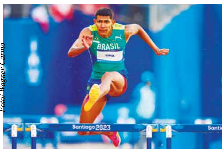
Matheus Lima: índices olímpicos nos 400 m rasos e nos 400 m com barreiras

“No Ibero, vamos buscar a constância nos tempos que vem fazendo. Tanto no Ibero quanto no GP acho que ele pode manter