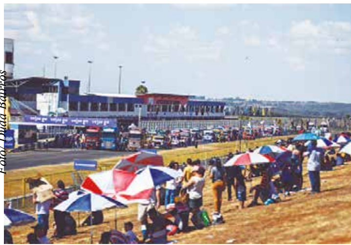
Copa Truck corre em abril e dezembro

Localizada em um terreno privilegiado, a pista sobreviveu ao tempo e hoje é considerada a principal praça do automobilismo brasileiro depois de Interlagos. A inauguração aconteceu com uma corrida de motociclismo – modalidade que brilhou por lá nos primeiros 20 anos de história, recebendo nos anos 80 provas da MotoGP, que ainda se chamava 500cc. Página 10