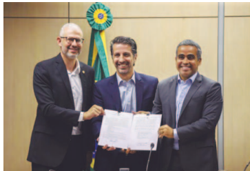
O Ministério do Meio Ambiente (MMA) lançou na quarta-feira (14) o programa Escolas + Verdes, que vai promover ações

de cidadania e educação ambiental nas escolas, como separação e tratamento de resíduos, reciclagem, logística reversa, reuso