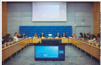
Reunião foi na sede da OCDE de Castelo de la Muette em Paris, na França

A sustentabilidade é muito importante e provar isso para o mundo também; você precisa explicar que o Brasil é sustentável, em todos os setores. A OCDE foi fundada em 16 de março de 1948, sua sede é no Castelo de la Muette, em Paris, França. Seus membros representam 42,8% do PIB global (54,2 trilhões de dólares) e alcança uma população de 1 bilhão e 300 milhões de pessoas. A sustentabilidade hoje é muito importante e demonstrar isso para o mundo, sem isso nosso país é bloqueado e não conseguiremos exportar nada.