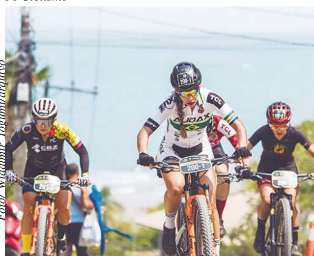
Campeonato Paulista de MTB - XCC/XCO

Competição será etapa única e será realizada no Thor Bike Trail. Inscrições já estão abertas no site oficial da FPCiclismo