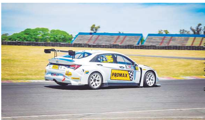
Piloto vai acelerar um Hyundai Elantra

Um dos pilotos mais jovens do mundo a acelerar um carro TCR, Pedro Aizza não vê a hora de iniciar mais um novo e importante capítulo de sua carreira.