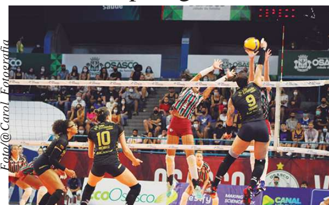
Tiffany ataca contra o Fluminense na Copa Brasil

Osasco São Cristóvão Saúde inicia "maratona" de jogos fora de casa na Superliga 21/22