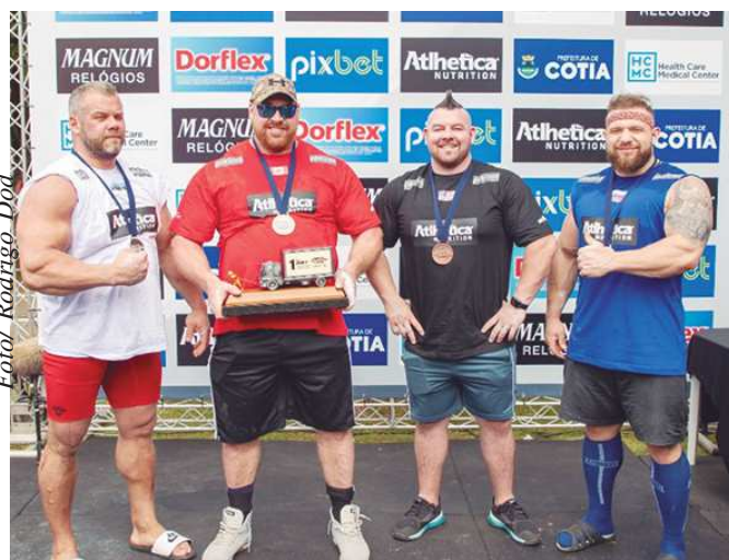
Premiação do quarteto

veio no maior desafio. Ele puxou um caminhão Mercedes-Benz Arocs 8x4 de 12 toneladas por 15 metros em 20s16 e “fechou a conta com 100% de aproveitamento”. O segundo colocado na prova, Rauno Heinla, fez o tempo de 1min04s27. O norte-americano e o russo não conseguiram cruzar a linha de chegada.