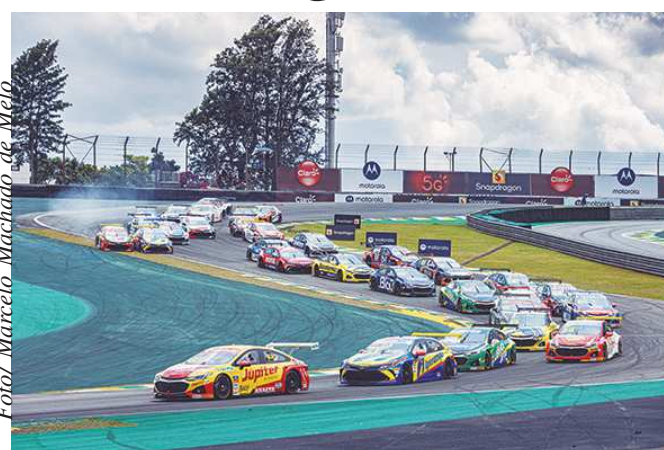
Largada da primeira bateria, com o pole position Casagrande à frente

Atual campeão, Casagrande foi o grande nome da primeira bateria ao cruzar a linha de chegada no primeiro lugar — com direito à volta mais rápida do dia (1min40s684). Página 6