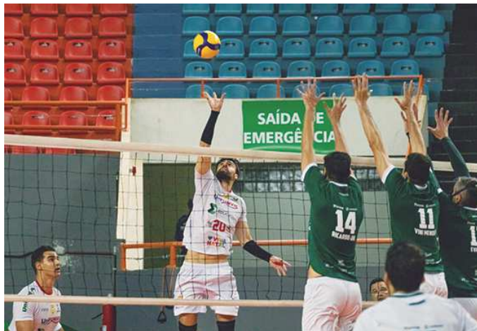
Funvic Educacoin Natal

O Funvic Educacoin Natal prepara-se para desafios contra times mineiros pela Superliga