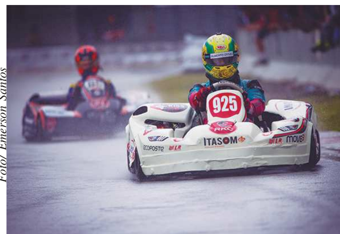
A equipe RKC Kiss FM IMAB II subiu ao pódio na categoria Light