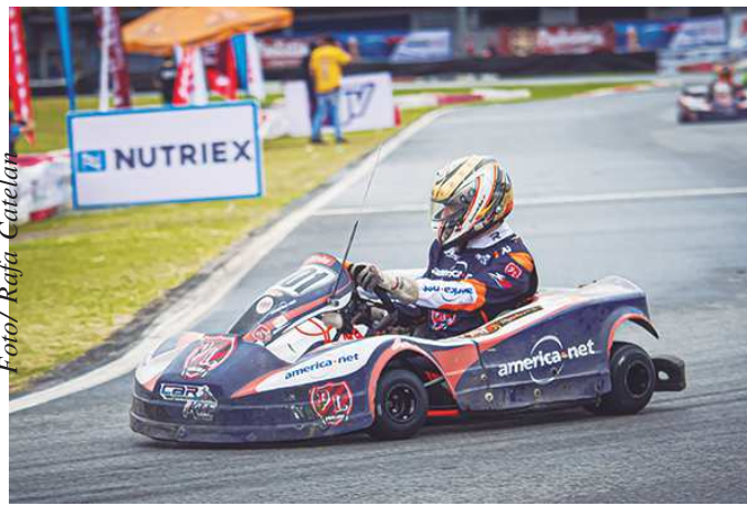
Kart #301 Car Racing/AmericaNet foi o vencedor

“É maravilhoso ganhar com essa equipe. Página 8