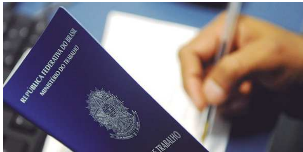
Página 3

Brasil gerou 2,7 milhões de empregos formais em 2021