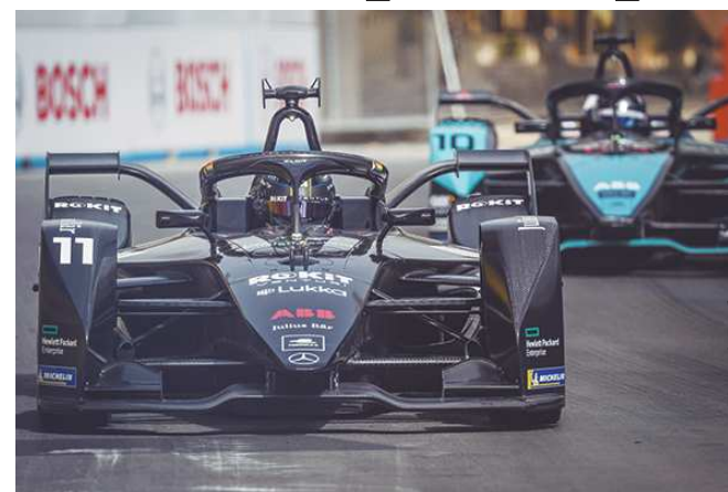
Foto: Rokit Venturi Racing brasileiro durante a etapa de sábado

Di Grassi estreia bem e sobe ao pódio pela 36ª vez