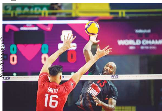
Funvic Educacoin Natal