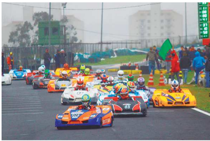
500 Milhas de Kart correrá em Interlagos na edição deste ano

Provas no Kartódromo de Interlagos estão marcadas para o sábado, véspera da disputa da 25ª edição da principal corrida do kartismo nacional