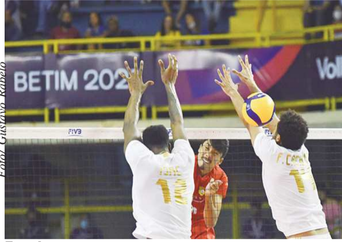
Funvic Educacoin Natal

O surto de Covid-19, aliás, atrapalhou os planos do Funvic Educacoin Natal neste começo de retorno. Com vários jogadores e membros da comissão técnica positivados, o time teve de adiar suas duas primeiras partidas pela Superliga 21/22, diante do Vôlei Goiás e do Vôlei Brasília, respectivamente. E agora,