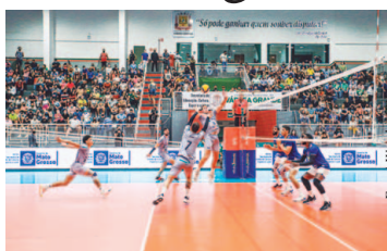
Funvic Educacoin Natal

Após a boa estreia em casa, quando bateu o Goiás Vôlei (3 a 0), o Funvic Educacoin Natal fará seu segundo jogo pela Superliga 2021/22 na noite deste domingo, dia 31 de