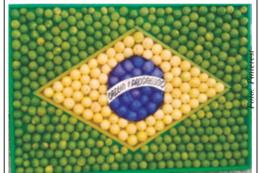
Brasil tem a meta de arrecadar US$ 1 bilhão com exportação de frutas em 2021

Comer frutas faz bem para a saúde. A alimentação original da humanidade é fruta. As frutas, fornecem fibras e vitaminas. Os limões e limas foram prejudicados pela seca, por temperaturas altas e também por geadas. Também a banana e o mamão apresentaram problemas com manchas. Mas mesmo assim os limões, limas e mamão tiveram bom desempenho nas exportações. O Brasil é o terceiro maior produtor mundial de frutas com cerca de 45 milhões de toneladas ao ano, das quais 65% são consumidas internamente e 35% são destinadas ao mercado externo. As tecnologias possibilitam o Brasil produzir uvas até mesmo no Sertão e colher duas safas de mangas.