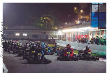
Os grids da Novatos são os mais cheios

Resultado da Novatos 1 da SM Kart Competition: 1) Rodrigo Borges, 18 voltas em