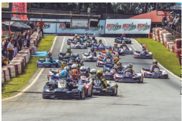
Copa São Paulo de Kart Granja Viana

A etapa de encerramento da Copa São Paulo de Kart acontece neste final de semana no Kartódromo Granja Viana, em Cotia, na Grande São Paulo. A decisão do campeonato definirá os campeões da temporada em todas as categorias – com exceção da Pró-500, que consagrará os gran-