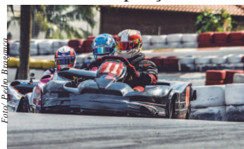
Copa São Paulo de Kart Granja Viana

O Kartódromo Granja Viana definiu nesta semana pelo adiamento do calendário da Copa São Paulo de Kart, que teria sua terceira etapa realizada no dia 4 de abril e do Endurance 10 Horas São Paulo-Paris, competição que seria realizada no dia 28 de março e premiaria os vencedores com uma vaga