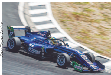
o brasileiro durante uma das etapas na Nova Zelândia: campeão em 2020