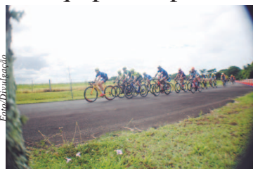
14ª Volta do Futuro/9ª Volta Feminina do Brasil

14ª Volta do Futuro/9ª Volta Feminina do Brasil com as principais equipes do país