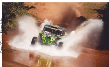
UTVs também farão parte do mundial

No Cross Country foram eleitas cinco provas: Abu Dhabi,