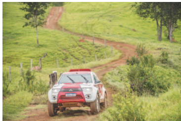
Concentração no Parque de Exposições de Patos de Minas

As inscrições estão abertas no site www.rallymakers.com.br para as categorias motos, quadriciclos, UTVs e carros