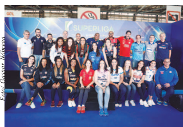
Representantes dos 12 clubes da Superliga Feminina 19/20

Nesta temporada a competição tem 18 atletas estrangeiros inscritos. Há atletas da Argentina, de Cuba, da Colômbia, Itália, Venezuela, Estados Unidos, Marrocos