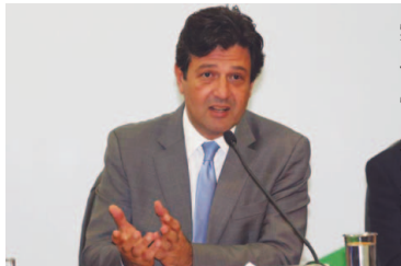
O ministro da Saúde, Luiz Henrique Mandetta, disse que o modelo público-privado deverá investir R$ 3 bilhões na construção do CIBS

Complexo deve produzir 120 milhões de vacinas por ano, diz ministério