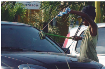
Campanha tem como tema este ano "Criança não deve trabalhar, infância é para sonhar"

Campanha contra trabalho infantil começa com tuitação