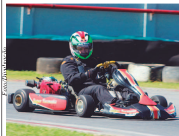
A Super Fórmula Master usará motores Honda de 21 hp sorteados

Categoria com equipamento que se aproxima dos utilizados em competições profissionais tem custo mensal baixíssimo