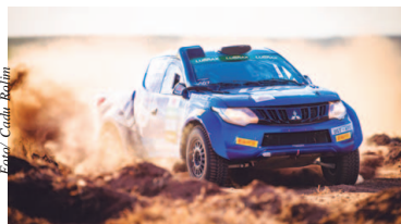
Competição comemora 20 anos

Logo cedo, no sábado, todos os competidores participarão do prólogo em uma pista montada a poucos metros do parque de apoio. "A cada etapa teremos uma novidade vinculada aos 20 anos