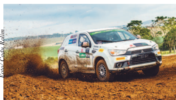
Competição comemora 20 anos