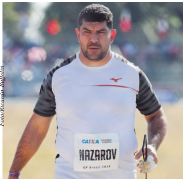
Dilshod Nazarov, campeão olímpico, em 2018

Realizado pela primeira vez em 1985, no Estádio Icaro de Castro Mello, no Ibirapuera, o torneio trouxe a capital paulista astros mundiais, como o norte-americano Edwin Moses, recor-