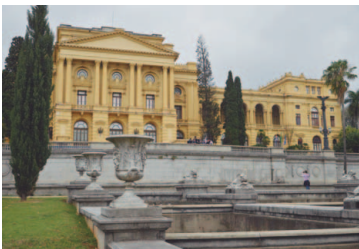
Museu do Ipiranga

"Estamos otimistas, temos que obter R$ 160 milhões, esse é o nosso objetivo e confio que vamos alcançar. O museu e os jardins do museu estarão totalmente recuperados, para, em setembro de 2022, fazermos uma grande celebração dos 200 anos