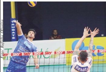
Duelo entre Vôlei Renata x EMS Taubaté Funvic

Segunda rodada das quartas de final conta com confrontos entre Vôlei Renata e EMS Taubaté Funvic, e Fiat/Minas e Sesc RJ