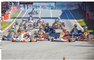
Copa São Paulo de Kart Granja Viana

A segunda etapa da Copa São Paulo de Kart Granja Viana acontece neste final de semana no Kartódromo Granja Viana, em Cotia (SP). Após a abertura da temporada com intensas disputas, a organização do torneio estreará uma das novidades para a edição de 2019: a categoria Super Rental, classe promocional que foi criada para pilotos poderem competir por um custo mais baixo e fazerem a transição do kartismo amador para o profissional. Outra novidade é a escolha do traçado desta etapa, que foi definido por uma eleição nas redes sociais do KGV.