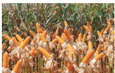
Plantação de milho

A safra de grãos 2018/2019 deve alcançar a marca de 233,3 milhões de toneladas, uma redução em relação ao levantamento anterior de 0,4%. Em relação à safra 2017/2018, a previsão indica aumento de 2,5%. Os dados do 6º levantamento foram divulgados na terça-feira (12) pela Companhia Nacional de Abastecimento (Conab).