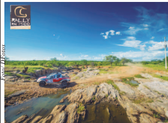
21º Rally RN 1500

Objetivo é participar da aventura sem o estresse da competição e motivar novos competidores