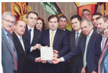
O presidente Jair Bolsonaro entrega proposta da reforma da Previdência aos representantes do Congresso Nacional

Bolsonaro pede apoio do Congresso e diz que futuro depende da reforma