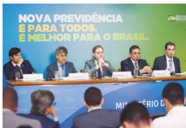
Ministério da Economia

lhador com 20 anos de contribuição começará recebendo 60% da média das contribuições, com a proporção subindo dois pontos percentuais a cada ano até atingir 100% com 40 anos de contribuição. Caso o