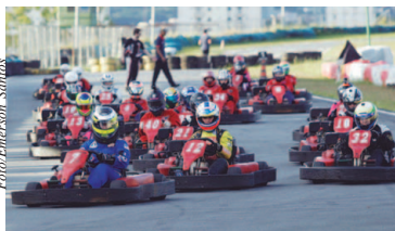
O Kartódromo de Interlagos já sediou outras edições da Corrida das Princesas

O domingo será cheio de atrações no Kartódromo de Interlagos. A programação do CCSKA terá início com um Mini-Endurance (16h) em duplas, seguido da largada da Corrida das Princesas (17h30), da bateria da categoria Graduados (18h), da prova da Light (18h30), culminando com a Seletiva Fórmula Vee/CCSKA (19h), que premiará os dois primeiros colocados com um treino no autódromo com um monoposto da Fó-