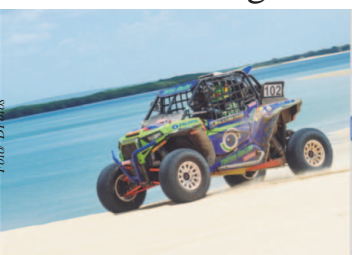
21º Rally RN 1500

Já consagrado como um dos melhores e mais queridos ralis do país, o Rally RN 1500 terá nesta temporada uma nova categoria, a Expedição RN 1500. Esta, entretanto, possibilitará participar de uma aventura única, mas sem toda