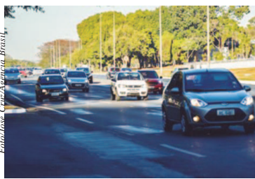
Subgrupo transporte individual registrou alta de 6,46% no ano.

Segundo o Dieese, no grupo transportes, os reajustes para os subgrupos transporte individual e transporte coletivo foram de 6,46% e 5,15%, respectivamente. A gasolina registrou o aumento mais significativo (12,51%). Em despesas diversas, gastos médios com animais domésticos (5,2%) e com comunicação (3,47%) apresentaram as maiores altas. Em educação e leitura, no subgrupo educação (4,61%), as taxas acumuladas foram de 5,39% para os cursos formais; 4,03% para os diversos; 1,60% para os artigos de papelaria; e -3,57% para os livros. No subgrupo leitura (12,99%), o reajuste para os jornais foi de 7,80% e para as revistas, de 14,61%.