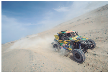
Equipe X Rally Team

Equipe ocupa a sexta e a 14ª posições na classificação geral dos UTVs. O time enfrenta mais 664 quilômetros até Tacna, no Peru