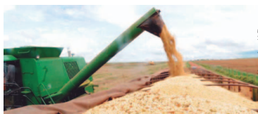
Safra de cereais

Safra de grãos de 2019 deve ser 3,1% maior que a de 2018, diz IBGE