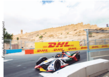
Di Grassi busca novo pódio no Marrocos

"No ano passado tivemos um começo complicado e a etapa do Marrocos foi uma das quais fomos severamente prejudicados por um problema técnico que durou até a quarta corrida — fizemos zero pontos até a quarta prova de 2018. Por isso eu não ter-