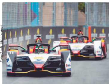
Lucas (à frente) ao volante do Audi e-Tron FE-05

Com praticamente seis pódios a cada dez corridas realizadas pelo Mundial de Fórmula E, o brasileiro Lucas Di Grassi inicia o ano de 2019 determinado a manter o impressionante índice que lhe deu a posição de recordista em toda a história da categoria. Di Grassi esteve entre os três melhores em 59% das provas disputadas desde 2014, ano de estreia da F-E com uma corrida vencida pelo brasileiro na pista de Beijing (China). Neste sábado (12), Lucas estará ao volante do Audi e-Tron FE-05 para a disputa da etapa de Marrakech, no Marrocos, pista onde o campeão de 2017 busca seu primeiro pódio. Página 8