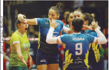
Comemoração do Sesc RJ

A 11ª rodada do turno da Superliga Cimed feminina de vôlei 18/19 será marcada pela reedição da última final da competição. O Sesc RJ receberá o Dentil/Praia Clube (MG), líder e atual campeão, às 21h30 desta sexta-feira (11), na Junesse Arena, no Rio de Janeiro.