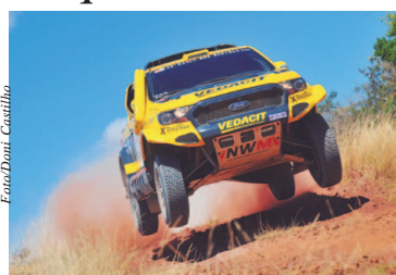
Equipe paulista é a atual tricampeã do Sertões entre os carros

Começa na próxima segunda-feira (7) em Lima, no Peru, o Dakar 2019. O maior e mais difícil rali do mundo terá 10 dias de duração e 5.600 quilômetros de percursos que desafiam pilotos, navegadores e suas máquinas em terrenos predominantemente de dunas, exigindo técnica, resistência e muita força mental. E nesta edição, dos 11 brasileiros que disputarão a prova entre os UTVs e as motos, quatro deles são da equipe paulista X Rally Team, tricampeã do Rally dos Sertões entre os carros. Página 6