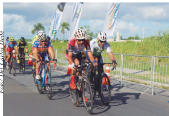
33º Torneio de Verão de Ciclismo

Evento será de 21 a 24 de fevereiro, mais uma vez na Ilha Comprida, reunindo algumas das principais equipes do país