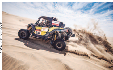
Trajeto será todo em território peruano, com muitas dunas

Pela primeira vez na história de mais de 40 anos, o Dakar será todo disputado dentro de um mesmo país. A prova terá a largada promocional neste domingo (6) nas ruas da capital Lima, e depois segue para Pisco, San Juan de Marcona, Arequipa e Tacna; na quinta etapa, começa o Ca-