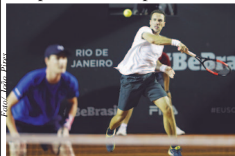
Bruno Soares e Jamie Murray disputam o Rio Open 2019

Aos 36 anos de idade e ocupando a sétima posição no ranking mundial, o tenista brasileiro Bruno Soares inicia na próxima semana, em Doha, no Catar, sua 19ª temporada como profissional. O mineiro, que já está treinando no Kalifa Stadium para a disputa do 1o. ATP de 2019, repetirá pelo quarto ano seguido a dupla com o britânico Jamie Murray. Em 2016, eles venceram o Australian Open e o US Open juntos.