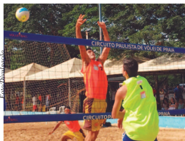
V Circuito Paulista de Vôlei de Praia