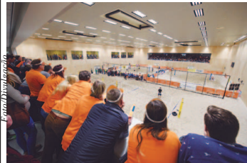
Disputa em Haia ocorre em quadra climatizada por conta do inverno europeu

Torneio em Haia conta com estrutura de quadras cobertas e climatizadas e país será representado por até quatro duplas