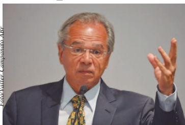
Ministro da Economia, Paulo Guedes

“Os economistas liberais sempre tiveram uma outra face, a do capital humano, a importância de investimento em saúde e educação. Pretendemos dar dinheiro para voucher [vales individuais] para saúde, creche e educação, investir na formação da criança de 0 a 9 anos. O governo tem essa ênfase, de um