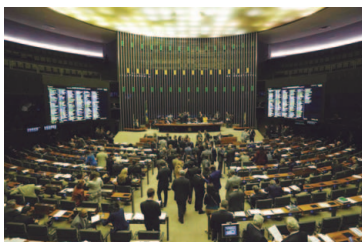
Câmara dos Deputados

Segundo o presidente da Câmara, deputado Rodrigo Maia (DEM-RJ), "quem tem condições" de iniciar o debate sobre o assunto é o próprio presidente eleito. "Falar quando vai ser votada se não precipitação. Esse é um assunto