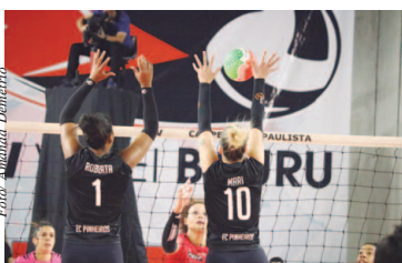
Campeonato Paulista Feminino de Vôlei 2018

O segundo finalista do Campeonato Paulista Feminino de Vôlei 2018 já está definido. Melhor equipe da primeira fase e ainda invicto na competição, o Sesi Vôlei Bauru derrotou o E.C. Pinheiros na partida de volta por 3 a 1, com parciais de 25/21, 25/22, 22/25 e 25/22, fechando o playoff semifinal. Em sua primeira final do principal torneio regional do país, a equipe terá pela frente o Osasco Audax, atual campeão e que busca o sétimo título consecutivo. Página 8