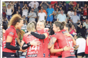
Campeonato Paulista Feminino de Vôlei 2018

O segundo finalista do Campeonato Paulista Feminino de Vôlei 2018 já está definido. Melhor equipe da primeira fase e ainda invicto na competição, o Sesi Vôlei Bauru derrotou o E.C. Pinheiros na partida de volta por 3 a 1, com parciais de 25/21, 25/22, 22/25 e 25/22, fechando o playoff semifinal. Em sua primeira final do principal torneio regional do país, a equipe terá pela frente o Osasco-Audax, atual campeão e que busca o sétimo título consecutivo.