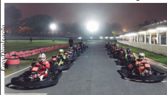
Grid do GP Nelson Piquet com Fábio PL na pole position

O piloto Alberto Otazú (Alpie Escola de Pilotagem/Instiuto Desenvolve/AVSP/Imab/Rolley Ball) venceu na terça-feira (16) o GP Nelson Piquet, em comemoração aos 35 anos da conquista do bicampeonato de Fórmula 1 pelo brasileiro. A prova no Kartódromo de Interlagos, em São Paulo (SP), foi válida pela sexta e penúltima etapa do Campeonato Karteiros Interlagos.