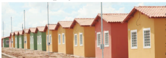
Imóveis financiados pelo Programa de Arrendamento Residencial, da Caixa, têm imunidade tributária e não pagam IPTU

STF decide que imóveis de programa habitacional não pagam tributos