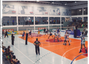
Campeonato Masculino de Vôlei

Equipes farão o segundo jogo em casa, precisando de mais uma vitória