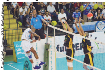
Campeonato Masculino de Vôlei

EMS Taubaté Funvic e Vôlei Renata vencem pelas quartas de final