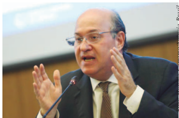
Taxa de juros pode voltar a subir, diz o presidente do Banco Central, Ilan Goldfajn

Ilan Goldfajn diz que crescem riscos para inflação no Brasil