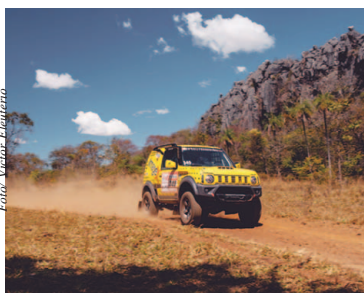
Prova termina no próximo sábado

A prova é um desafio não só para as máquinas, mas também para as duplas, que têm que en-