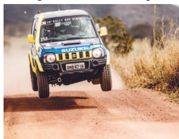
Serão 3.600 km até Fortaleza

Um SUV forte e resistente que encara todos os desafios. Duas duplas escolheram o Suzuki Jimny para, nesta se-