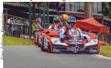
Equipe Car Racing-America Net venceu as 500 Milhas em 2016 e fez a pole em 2017

A próxima etapa da Copa São Paulo de Kart, que será disputada no dia 15 de setembro no Kartódromo Granja Viana, terá uma atração inédita nos últimos anos: a liberação do uso do traçado tradicional das 500 Milhas para a cate-