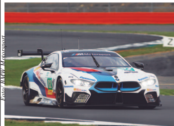
Brasileiro destacou pontos positivos da participação nas 6H de Silverstone

Brigando pelo top-5, problema mecânico tirou a BMW #82 da disputa por pontos na prova de 6 Horas de Silverstone. Agora, o brasileiro segue para a etapa italiana do DTM