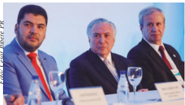
Ministro da Indústria, Marcos Jorge; o presidente, Michel Temer, e o presidente Instituto Aço Brasil, Sergio Leite, durante o Congresso Aço Brasil 2018

De acordo com o Instituto Aço Brasil, a produção de julho apresentou alta de 6,7% em relação ao mesmo mês do ano passado. No mês passado, as vendas tiveram alta de 13% sobre julho de 2017. “Alguns dizem que a recuperação não seria sustentável. Hoje, um ano depois, temos a segurança de afirmar