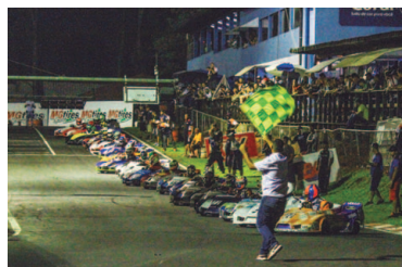
Pro-500 na Copa SP de Kart

Competição no dia 15/9 será oportunidade única para pilotos e equipes se prepararem para a principal corrida de longa duração do kartismo nacional