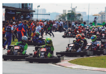
Largada das 24 Horas Rental Kart Interlagos

24 Horas Rental Kart Interlagos: Os Tartarugas viraram Dragão