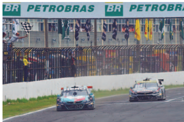
Lucas Di Grassi

Londrina fez grande festa para a quarta etapa da Stock Car, disputada neste domingo (6) na cidade do norte paranaense. O Autódromo Internacional Ayrton Senna viu os carros da principal categoria do automobilismo brasileiro de casa cheios, com arquibancadas e camarotes absolutamente lotados.