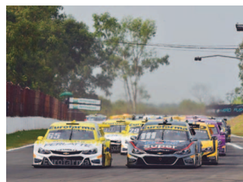
Largada (Corrida 1)

Max Wilson e Lucas di Grassi triunfam em Londrina