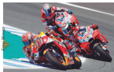
Marquez (93) mais uma vitória e a liderança do campeonato

Max Wilson e Lucas di Grassi triunfam em Londrina