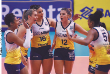
Vôlei Nestlé está em terceiro lugar

"Estamos treinando com intensidade desde o dia 2 de janeiro. Não dá para baixar o ritmo. Neste ano a Superliga está muito forte, equilibrada e técnica"