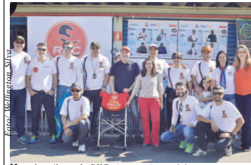
Um dos pilares do RKC são as ações sociais

É esperada a participação de mais de 50 pilotos em duas categorias no campeonato do Rotary Club