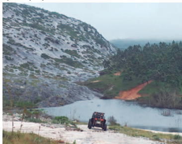
Os participantes conhecerão as mais belas paisagens mineiras durante o evento

A montanhosa Conceição do Mato Dentro será a anfitriã da primeira etapa do Campeonato Brasileiro de Rally Cross Country e Rally Baja 2018