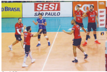
Sesi-SP comemora ponto

Sada Cruzeiro x Sesc RJ e Sesi-SP x EMS Taubaté Funvic serão no dia 25 de janeiro, com transmissão do SporTV