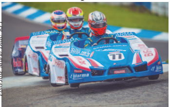
500 Milhas de Kart Granja Viana

A 21ª edição das 500 Milhas de Kart terá transmissão ao vivo dos canais Sportv no dia 16 de dezembro. A prova irá acontecer no Kartódromo Granja Viana, em Cotia (SP), e o horário da largada está confirmado para as 12h30 do sábado, com exibição da primeira e da última hora da corrida no canal a cabo. O restante da principal prova de endurance do kartismo brasileiro será exibido no site Sportv.com, também ao vivo.