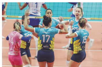
Sesc RJ luta pela terceira vitória

Renata Valinhos/Country busca primeira vitória contra Sesc RJ