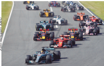
Largada do GP do Japão

"Nós fizemos um trabalho incrível até aqui. Foi uma pena o que houve nessas últimas corridas. Agora, temos de ver o que acontece. Ainda temos uma chance, mas certamente não temos mais tanto controle quanto gostaríamos. Nós fomos muito mais longe do que as pessoas pensa-