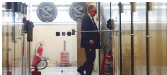
Presidente do Comitê Olímpico Brasileiro (COB) Carlos Arthur Nuzman

MPF pede prisão por tempo indeterminado de Nuzman