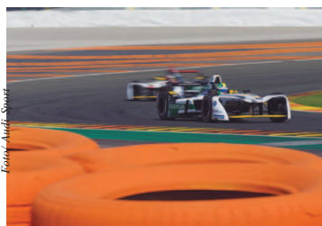
Lucas di Grassi

Lucas di Grassi tem se mostrado contente com o progresso obtido até agora na evolução do Audi e-tron FE04, carro com o qual defenderá o título na temporada 2017-2018 da Fórmula E, que começa no dia 2 de dezembro em Hong Kong. Atual campeão da categoria, o brasileiro da Audi Sport Abt Schaeffler foi um dos poucos a melhorar o tempo em relação à sessão da manhã na terça-feira (3) em Valência e ficou com a segunda melhor marca da tarde, fechando o dia em sexto no geral. Página 6