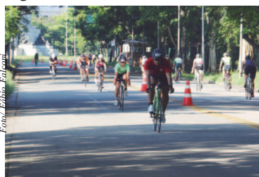
Circuito TRIDAY Series 2017

O IRONMAN 70.3 Rio de Janeiro nem bem acabou e o Recreio do Bandeirantes, no Rio de Janeiro, já se prepara para mais uma importante prova do calendário nacional. Trata-se da quinta etapa do Circuito TRIDAY Series, competição criada pela Unlimited Sports para dar mais opções para atletas novatos e experientes, movimentando o segmento. A disputa terá duas distâncias, Sprint - 750m de natação, 20km de ciclismo e 5km de corrida - e Olímpico - 1,5km/40km/10km, e acontecerá na Praia da Macumba. Página 6