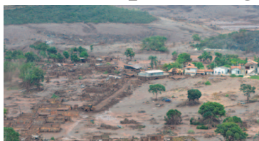
Rompimento da barragem em Mariana MG