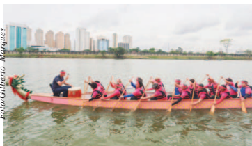
O barco será destinado a pacientes que fizeram tratamento contra o câncer de mama no Instituto do Câncer do Estado de São Paulo (Icesp)

"O câncer é uma doença curável, desde que diagnosticada e tratada adequadamente. E o Outubro Rosa é dedicado à prevenção e tratamento do câncer de mama, que é o que mais preocupa nas mulheres", comentou Alckmin.