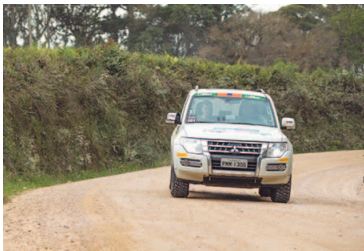
Rali será no dia 23 de setembro

Prova off-road mais tradicional do Brasil chega ao interior de São Paulo no dia 23 de setembro