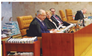
O relator ministro Edson Fachin durante sessão do STF para decidir sobre suspeição do procurador-geral da República para atuar nas investigações relacionadas ao presidente Michel Temer

Por 9 votos a 0, o Supremo Tribunal Federal (STF) rejeitou na quarta-feira (13) pedido feito pela defesa do presidente Michel Temer para que seja declarada a suspeição do procurador-geral